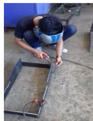
Gambar 4. Proses Pembuatan Rangka

Rangka utama pada mesin pencetak getah gambir ini, dibuat dengan besi plat ketebalan 4 mm. Pemilihan material ini dikarenakan bentuk rancangan rangka yang bertingkat menjadikan pemilihan plat 4 mm lebih cocok untuk digunakan. Dimensi dari rangka alat pencetak getah gambir ini berukuran 50 x 70 cm pada rangka terdapat lengan press yang akan digunakan untuk kedudukan dongkrak penekan getah. Berikut adalah gambar proses pembuatan rangka.