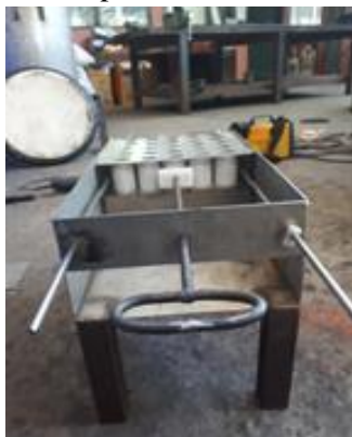
Gambar 7. Pemasangan Media Cetak pada Alat Cetak

Media cetak akan dipasang dengan menggunakan slider pada bodi alat pencetak ini.