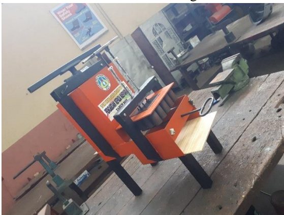
Gambar 13. Hasil Akhir Alat Cetak Getah Gambir Sistem Impact