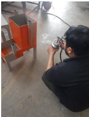
Gambar 12. Proses Pengecatan

Proses finishing pada proses pembuatan alat cetak getah gambir ini meliputi proses penggerindaan dan pengecatan. Proses penggerindaan bertujuan membersihkan sisa hasil pengelasan. Dan proses pengecatan bertujuan untuk menjaga supaya alat ini tidak mudah karatan dan memperindah tampilan visual dari alat cetak.