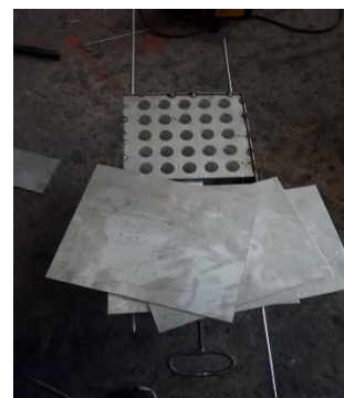
Gambar 10. Pembuatan Kotak Penampung

Kotak penampung getah ini merupakan media meletakkan getah sebelum dilakukan pencetakan. Kotak ini dibuat dengan tinggi 30 cm. Kotak ini dibuat dari besi stenlis.