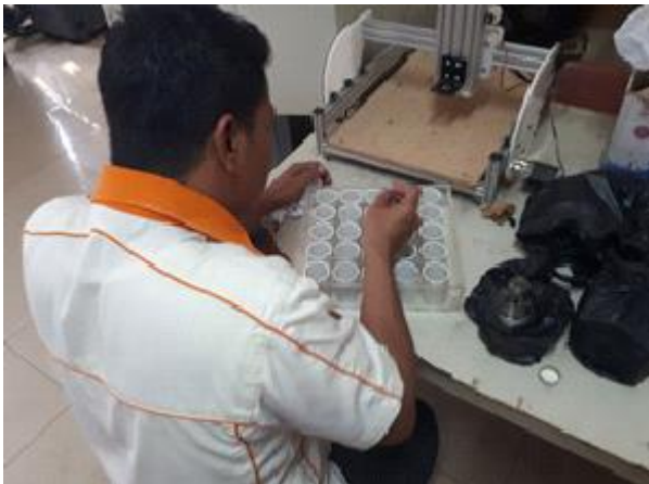
Gambar 6. Proses Finishing Pembuatan Media Cetak

Media cetak akan dipasang dengan menggunakan slider pada bodi alat pencetak ini.