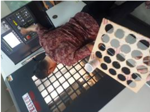
Gambar 5. Proses Pembuatan Media Pencetak Dengan Mesin CNC

Silinder cetakan ini menjadi salah satu komponen utama pada alat pencetak. Silinder pencetak ini dibuat dari pipa PVC dengan diameter 1,5 inci. Tinggi dari silinder pencetak ini adalah 10 cm dengan jumlah silinder 25 buah silinder. Untuk dudukan cetakan ini digunakan akrilik 5 mm. Luas dudukan cetakan adalah 25 x 25 cm. Proses pembuatan selinder cetakan ini menggunakan mesin CNC. Hal ini dilakukan untuk mendapatkan hasil cetakan yang akurat dan seimbang dari getah gambir yang akan di cetak nantinya. Berikut adalah dokumentasi proses pembuatan silinder pencetak.