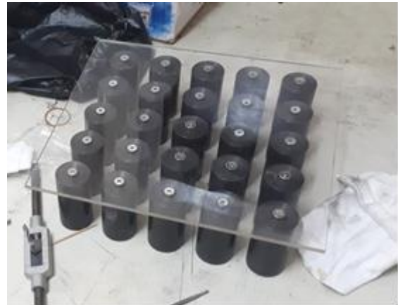
Gambar 8. Media pendorong getah dari cetakan

Pendorong getah dari cetakan ini dibuat dari form plastik dengan diameter 1,5 inci. Pendorong getah pada cetakan ini dibuat secara berjejer disesuaikan dengan silinder media cetak yang telah dibuat. Berikut adalah bentuk media pendorong getah dari cetakan.