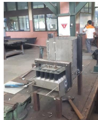
Gambar 9. Pemasangan Media Pendorong pada Alat Cetak

Pemasangan media pendorong ini pada alat cetak akan menggunakan sistem pegas sehingga media pendorong akan kembali kepada posisi semula setelah melakukan pendorongan getah.