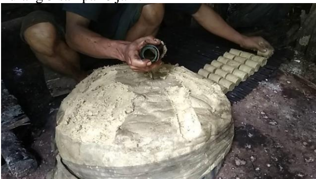
Gambar 1. Proses Pencetakan Manual

Dimensi yang dihasilkan dari produksi gambir ini sudah berlangsung sejak turun temurun. Permasalahan yang ada pada kelompok tani adalah proses pencetakan hasil pengolahan getah gambir masih dilakukan secara manual. Untuk mencetak 20 Kg getah gambir dibutuhkan waktu lebih kurang 5 sampai 8 jam.