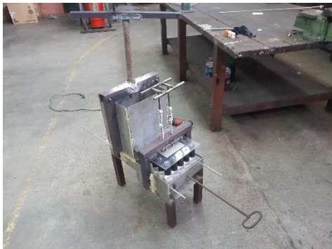
Gambar 11. Pemasangan Ulir Impact

Sistem impact yang dibuat pada alat cetak ini adalah dengan menggunakan ulir 2 inchi.