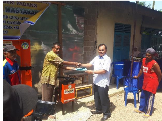
Gambar 14. Serah Terima Alat Cetak Gambir dengan Pejabat Kenagarian

pengoperasian alat yang mana di terapkan pada khalayak sasaran di Kenagarian Kapuh Kecamatan Koto XI Tarusan Pesisir Selatan. Proses ini merupakan proses yang ditunggu-tunggu oleh masyarakat. Permasalahan masyarakat yang selama ini mencetak getah gambir dengan cara manual membutuhkan waktu yang lama dan tenaga yang banyak terpecahkan dengan adanya alat cetak getah gambir system impact ini. Berikut ini adalah dokumentasi acara serah terima alat cetak gambir system impact dengan pejabat kenagarian.